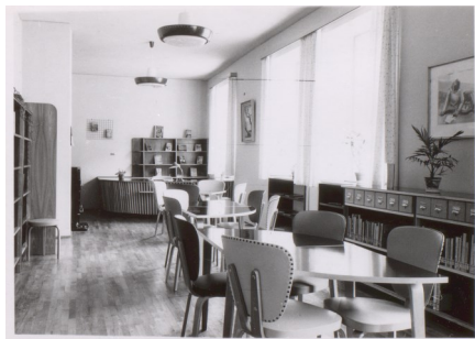
Stadtbücherei, 1957

Fest steht, dass die Stadtbibliothek trotz ihres Alters noch immer auf der Höhe der Zeit ist.